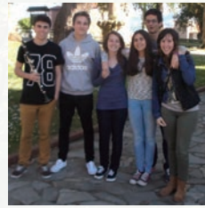
スペイン・サンタンデール音楽院・学生アンサンブル

サンタンデール音楽院・教授。ソリストとしてスペイン、イギリス、フランス他で演奏活動を行う。02年ブラジル発見500年祭、04年ワン・ワールド・ビート国際フェスティバル等多数出演。ギター、朗読、ダンス、映像による「Guitarte Gaudi」(ガウディ)をプロデュース。